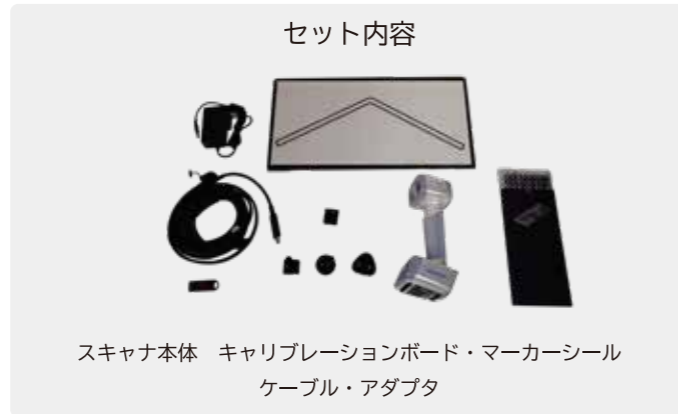
EinScan H スキャナ本体 キャリブレーションボード・マーカースील ケーブル・アダプタ