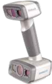
EinScan H(本体+ソフト+ケーブル類) ¥780,000-(税抜)