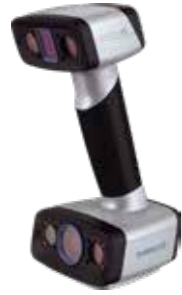
EinScan HX(本体+ソフト+ケーブル類) ¥1,850,000-(税抜)