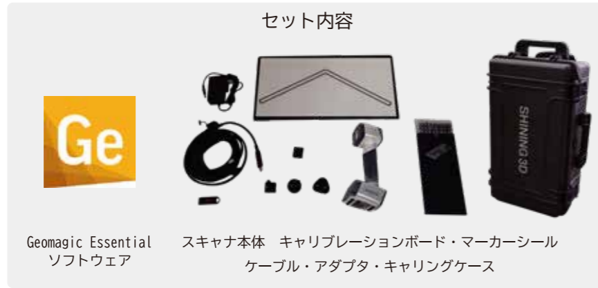
Geomagic Essential ソフトウェア EinScan HX スキャナ本体 キャリブレーションボード・マーカースील ケーブル・アダプタ・キャリングケース