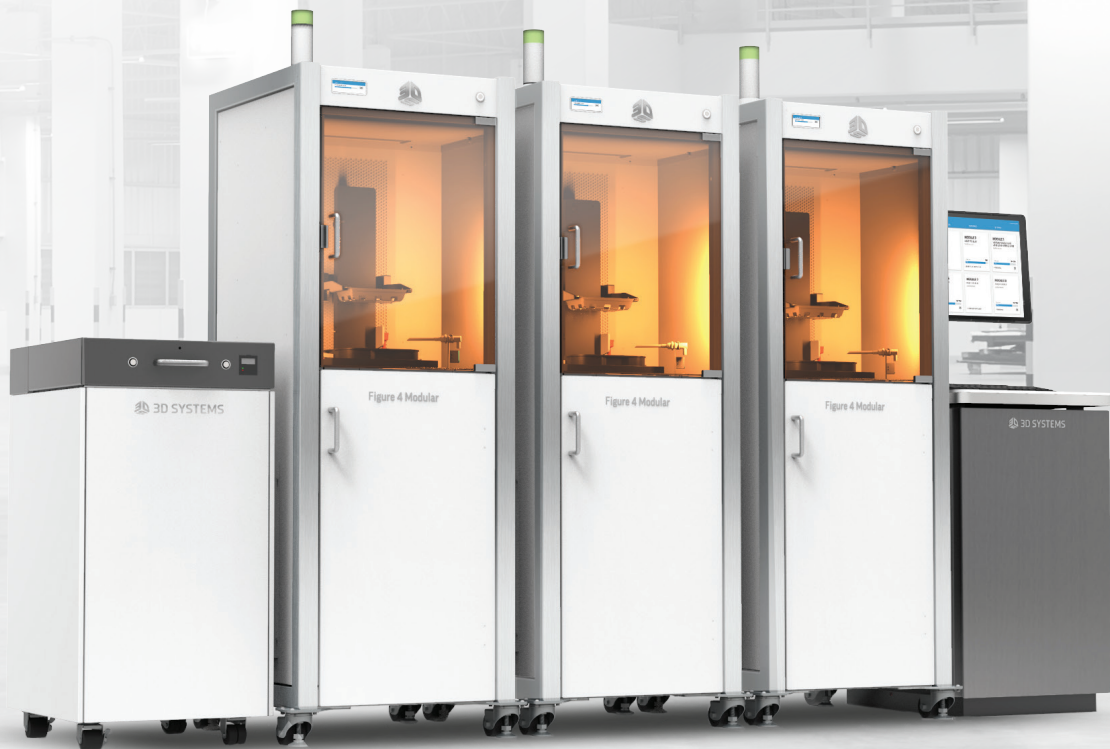
Figure 4 Modular はビジネスの成長に合わせて拡張できるスケーラブルな半自動 3D 生産ソリューションです。現在と将来のニーズに対応して、生産能力は 1 ヶ月あたり 最大 10,000 個まで拡張できるため、前例のないほど機敏な製造を可能にします。

プロトタイピングと生産のニーズに合わせて拡張可能 スケーラブルな半自動3Dマニファクチャリング ソリューション