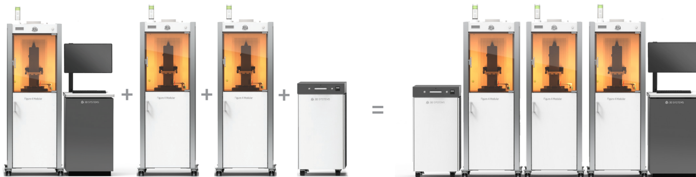
ベースユニット(コントローラとプリンタ1基)

最大24基までプリントエンジンを増設可能なうえ、ジョブとキューの自動管理、材料の自動供給、集中型の後処理機能を備えているため、Figure 4 Modularのエンドツーエンドのデジタル製造ワークフローは、少量から中量の生産とブリッジマニュファクチャリングに最適です。また、プリンターごとに異なる材料やジョブを単一の高スループットラインの一環として実行でき、多数のパーツを生産します。