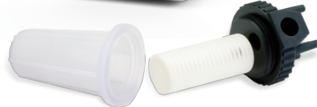
クリア、ホワイトおよびブラック色のリジッドプラスチックでプリントされた機能フィルタープロトタイプ