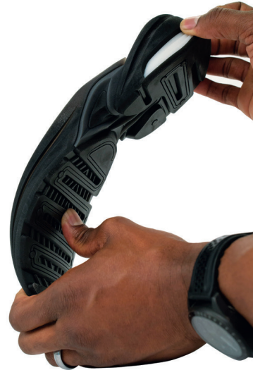
柔軟性のあるブラックエラストマーと、硬質白のプラスチックでプリントした靴のソール

3D Systems社のマルチジェットプリンティング (MJP) プロセスは、プロトタイプ、ラピッド ツーリング、その他の多くの用途に活用できる精密なプラスチック・パーツを作成します。ABSライクの硬質樹脂材は剛性と柔軟性を備えたパーツを造形し、エラストマー材料は機能性および高い性能のパーツを造形します。カスタマイズした機械特性を備えたパーツを複合材料を使って造形し、オーバーモールドなどの特殊な特性を備えた複雑なパーツも作成できます。